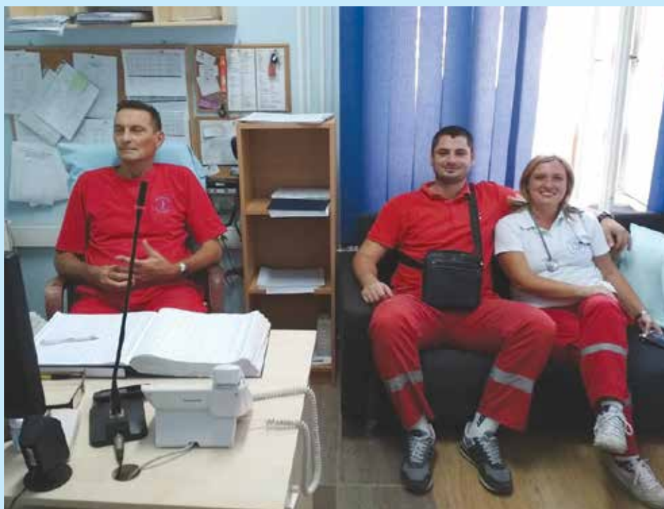
Дежурна екипа у хитној служби Суботица: „Верујемо у Синдикат. Надамо се да ће Синдикат успети да избори боље услове рада, више запослених и ВЕЋЕ ПЛАТЕ“.