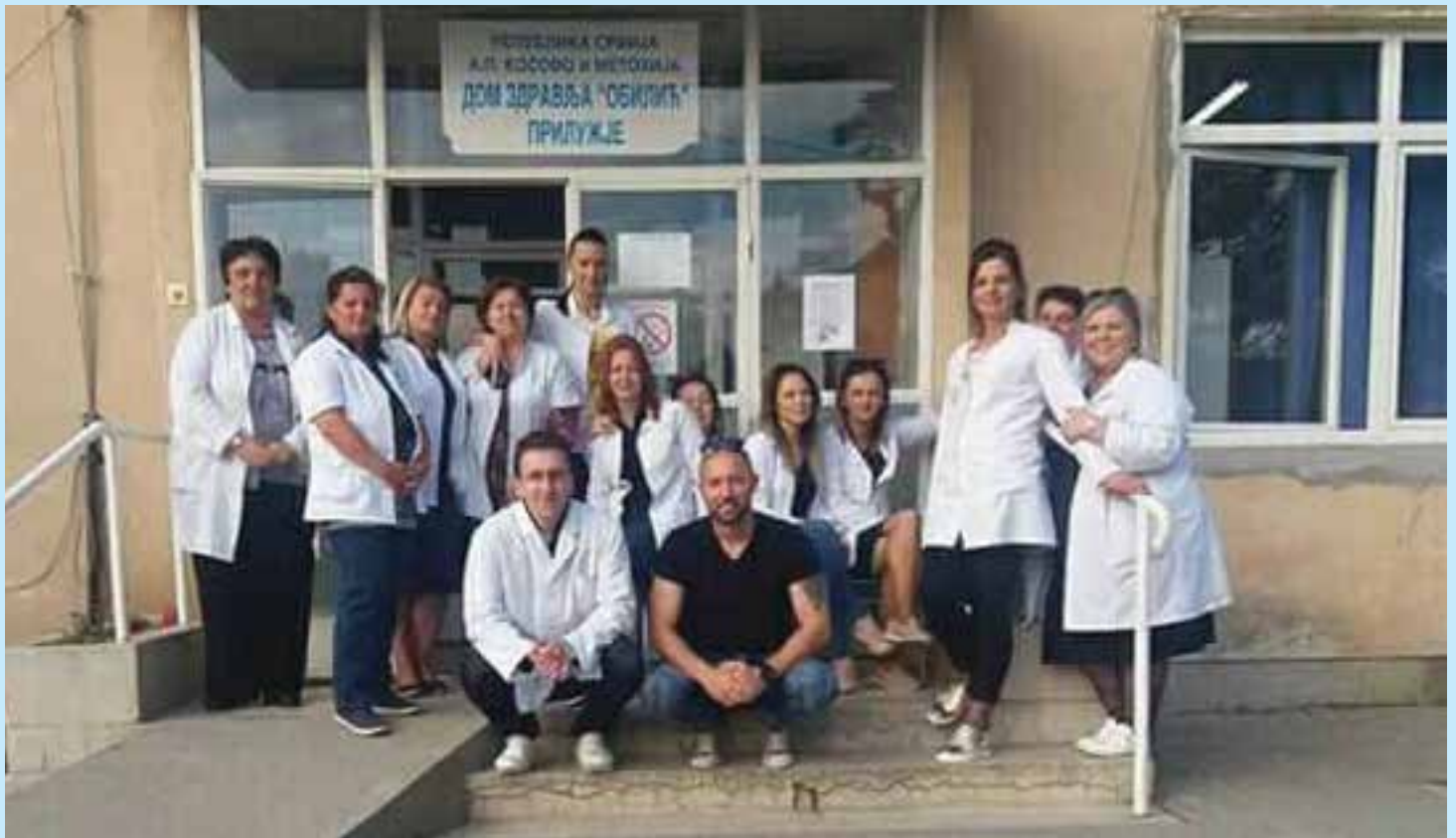
Радници Дома здравља Прилуке